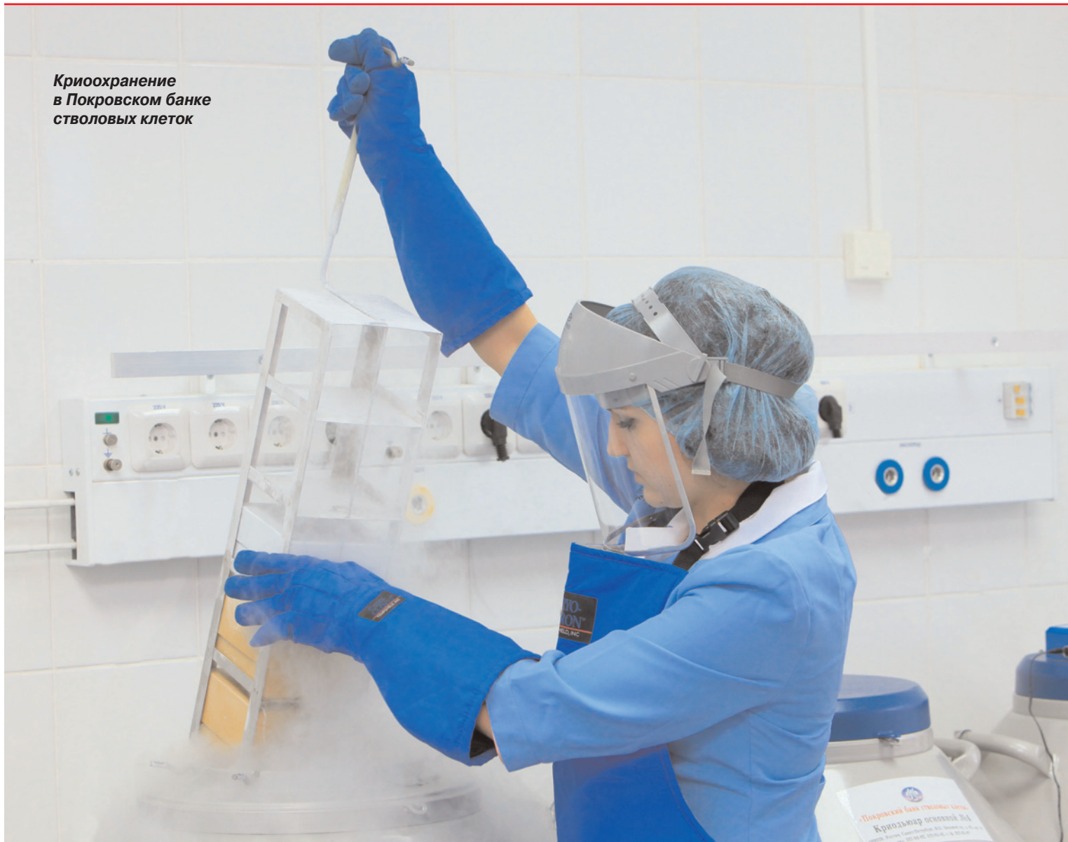
Криохранение в Покровском банке стволовых клеток